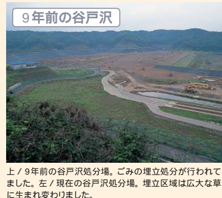
上 / 9年前の谷戸沢処分場。ごみの埋立処分が行われていました。左 / 現在の谷戸沢処分場。埋立区域は広大な草原に生まれ変わりました。