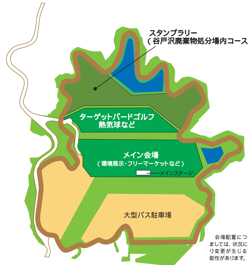
会場配置につきましては、状況により変更が生じる可能性があります。

主催 東京都三多摩地域廃棄物広域処分組合 共催 日の出町 / 多摩地域25市1町(処分組合組織団体) 後援 東京都