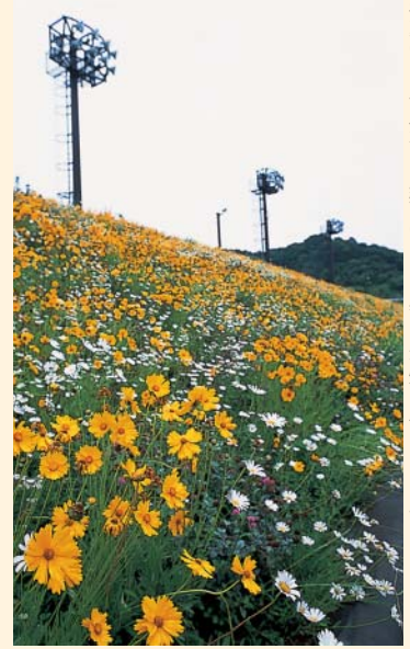
初夏の頃、谷戸沢には絵画のよう美しい花畑が広がっています。

鳥類は107種が確認されました。清流復活事業として創出された水辺には、埋立前より数を増やしたセキレイ類やタビバリなどが見られます。また、日の出町の天然記念物であるトウキョウサンショウウオやひっそりと暮らすタヌキの姿も観測されています。温暖な季節には22ヘクタールの広大な平原に、色とりどりの花が咲き乱れ見応えのある美しい光景です。