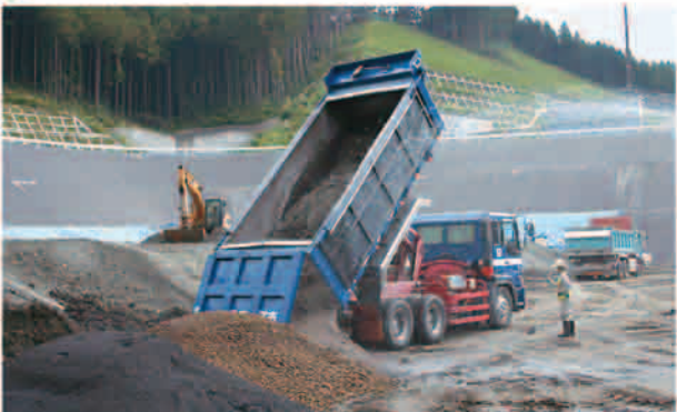
二ツ塚処分場のごみ焼却灰埋立の様子（平成16年9月撮影）。

平成16年9月に一部の新聞において、国内219の処分場が国の安全基準に適合しないまま使用されているとの報道がありましたが、多摩地区のごみを埋め立てている二ツ塚処分場、および埋立を完了した谷戸沢処分場は、国の基準を十分にクリアし、国内最高水準の管理体制のもと安全に運営されています。