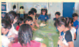
展示物を真剣に見つめる小学生のみなさん。

処分組合は、年間を通じて小学生や親子などによる処分場見学を積極的に受け入れています。社会科の授業で「ごみ」について学習する小学4年生の見学者数は、平成15年度には883名、平成16年度は9月現在で、334名でした。