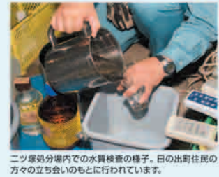
ニッ塚処分場内での水質検査の様子。日の出町住民の方々の立ち会いのもとに行われています。