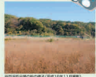
谷戸沢処分場の秋の様子(平成16年11月撮影)。

谷戸沢処分場は、多摩地域の廃棄物を昭和59年から14年間にわたり埋立処分した処分場です。平成10年4月に埋立を終了した後も、処分組合では適切な維持管理を行い、長期の生態モニタリング調査を続けています。現在では広大な草原となり、四季を通じてさまざまな動植物が確認されています。