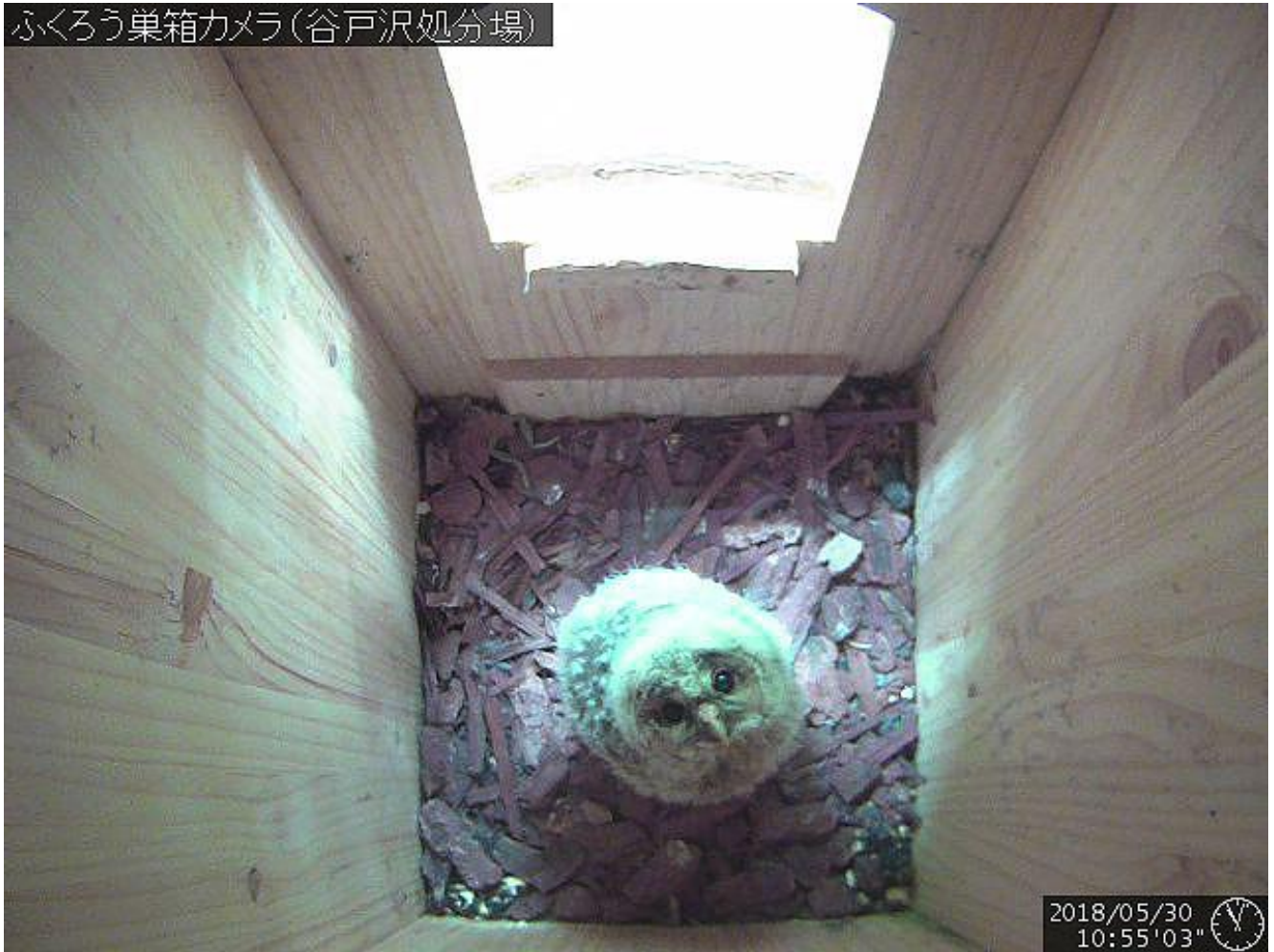
6月3日に巣立ちを確認したフクロウのヒナ（6月2日撮影）