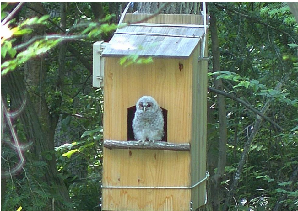
巣箱から姿を見せる フクロウのヒナの様子 （6月2日撮影）

フクロウなどの猛禽類が営巣・子育てすることは、処分場内及びその周辺地域の生態系の豊かさを示す指標となります。これからも、当組合では鳥類や動植物のモニタリングを継続的に行うとともに、豊かな自然環境の保全・創出に努めてまいります。